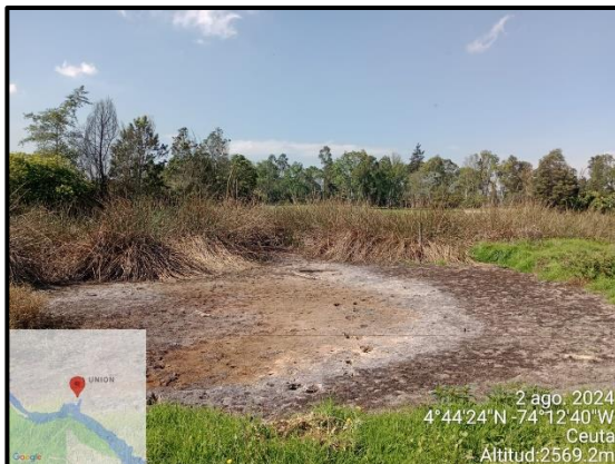
Ilustración 5. Disminución volumen aguas, punto 3.

C.P.250020 Tel. +57(1) 823 40 70 823 40 71 / 823 40 73 Fax. + 57(1) 825 76 20 Dir. Cra. 14 No. 13-05