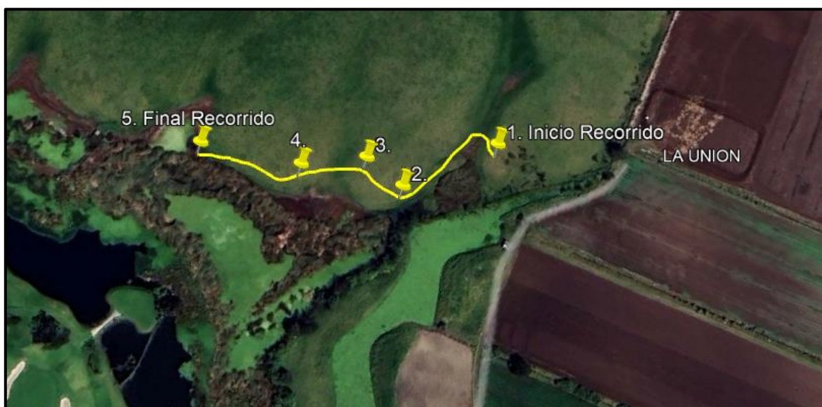
Ilustración 1. Recorrido ronda Humedal Gualí – Vereda El Cacique.

El día 02 de agosto de 2024, se realizó recorrido de control y vigilancia en la ronda del humedal Gualí, desde las coordenadas 4°44'26"N – 74°12'38"W hasta las coordenadas 4°44'22"N – 74°12'43"W (ilustración 1. Ruta amarilla), ecosistema que fue declarado por la Corporación Autónoma Regional de Cundinamarca – CAR como Distrito Regional de Manejo Integrado a través del acuerdo 001 de 2014 "Por medio del cual se declaran como Distrito Regional de Manejo Integrado (DMI), los terrenos comprendidos por los humedales de Gualí, Tres Esquinas y Lagunas de Funzhé, y su área de influencia directa ubicada en los municipios de Funza, Mosquera y Tenjo, Cundinamarca", y estableció tres zonas: 1. Preservación (espejo de agua), 2. Recuperación (50 metros) y 3. Uso sostenible (100 metros), con el fin de identificar presuntas afectaciones ambientales