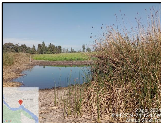
Ilustración 7. Disminución volumen aguas, punto 5.