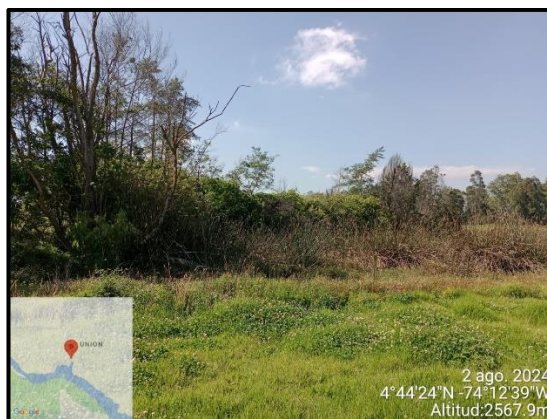
Ilustración 4. Evidencia recorrido, punto 2.