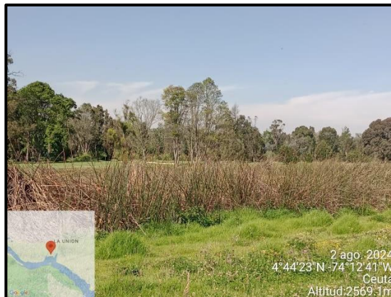
Ilustración 6. Evidencia recorrido, punto 4.