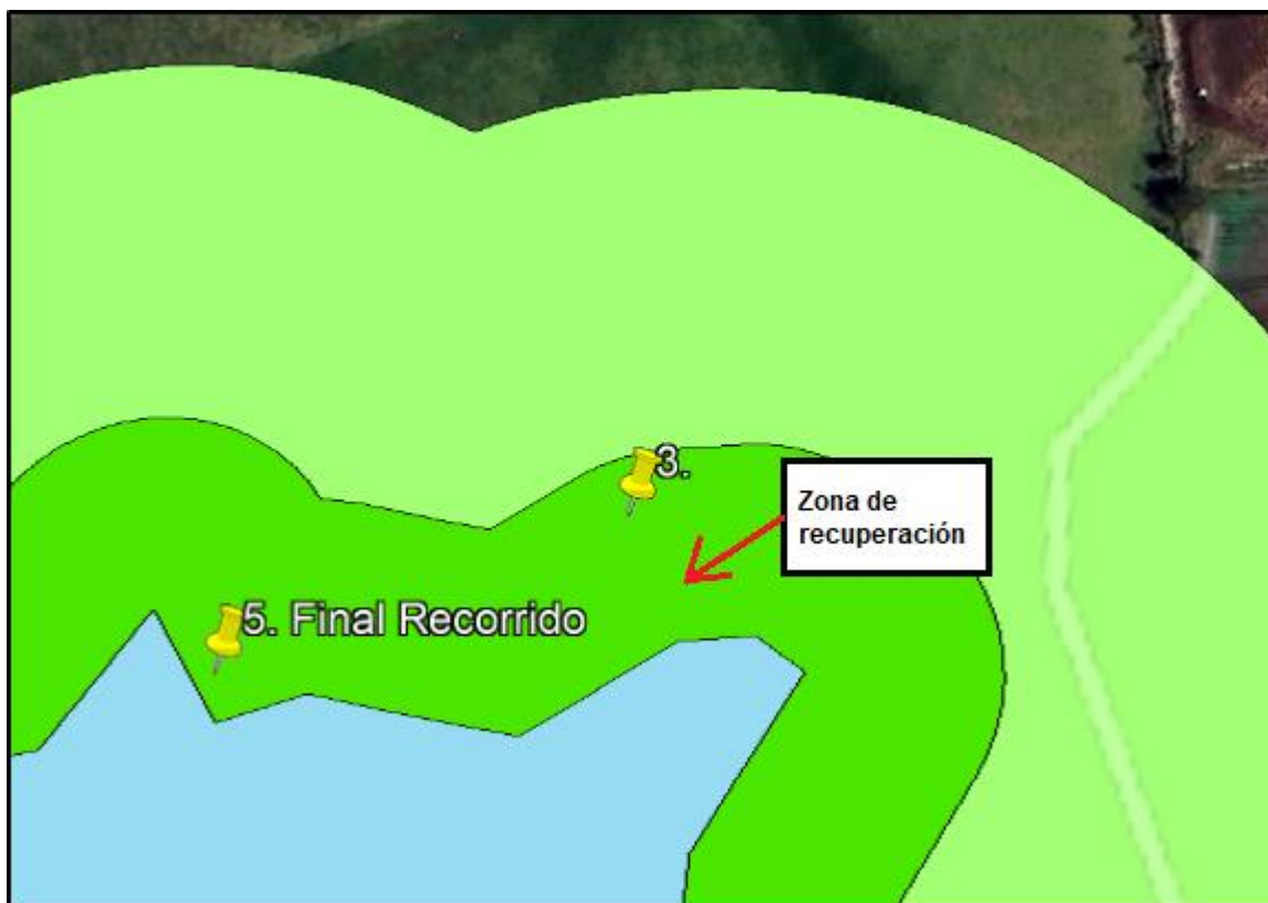
Ilustración 2. Puntos donde se evidenciaron afecciones en la zona de recuperación del humedal Gualí – vereda El Cacique.

Durante el recorrido en el humedal Gualí en la vereda El Cacique, no se evidenció presencia de motobombas, ganado, residuos ni posibles rellenos; sin embargo, dentro del recorrido en el punto 3 con coordenadas 4^{\circ}44'24.00''\text{N} - 74^{\circ}12'40.00''\text{O} y en el punto 5 con coordenadas 4^{\circ}44'22.00''\text{N} - 74^{\circ}12'43.00''\text{O} , pertenecientes a la zona de recuperación (ver ilustración 2), se evidenció la reducción del volumen de las aguas ocasionada por un posible déficit en las precipitaciones.